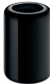
Apple Mac Pro, 2013

Dans le domaine de la musique voir par exemple : Philip Glass Glassworks