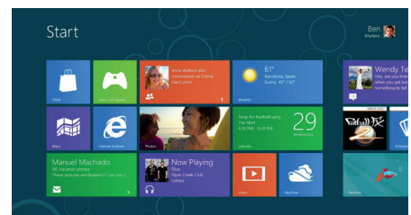
L'interface « Modern UI » de Microsoft Windows 8