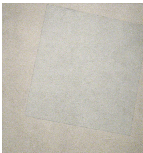
Kasimir Malevitch (1918), Carré blanc sur fond blanc