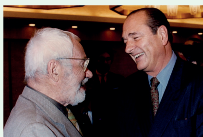
Ci-contre, Max Bill (à gauche sur la photo) félicité par Jacques Chirac à Tokyo en 1993.