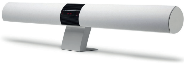
Bang & Olufsen BeoLab 3500