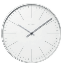
Max Bill (années 1960), Horloge murale Junghans